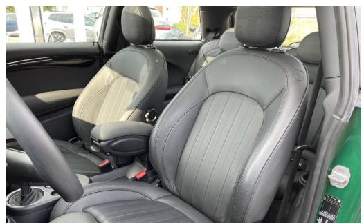
BMW MOTORRAD Auton Scania PAGO VOGELSANG AUTOMOBILE