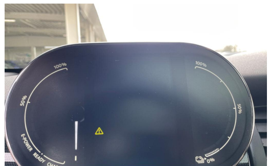
BMW MOTORRAD Auton Scania PAGO VOGELSANG AUTOMOBILE