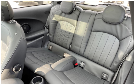
BMW MOTORRAD Auton Scania PAGO VOGELSANG AUTOMOBILE