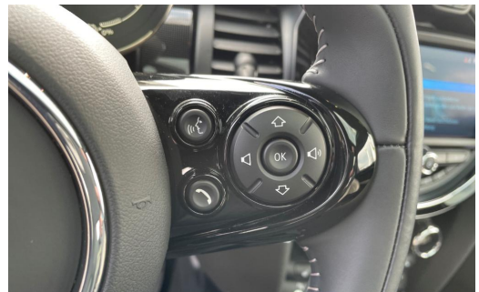
BMW MOTORRAD Auton Scania PAGO VOGELSANG AUTOMOBILE