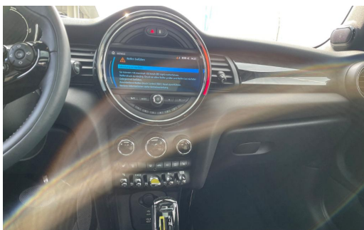
BMW MOTORRAD Auton Scania PAGO VOGELSANG AUTOMOBILE