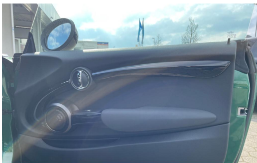
BMW MOTORRAD Auton Scania PAGO VOGELSANG AUTOMOBILE