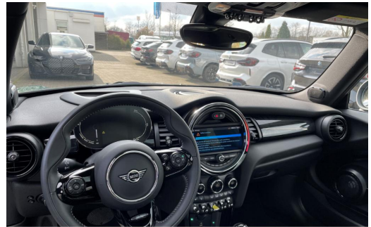
BMW MOTORRAD Auton Scania PAGO VOGELSANG AUTOMOBILE