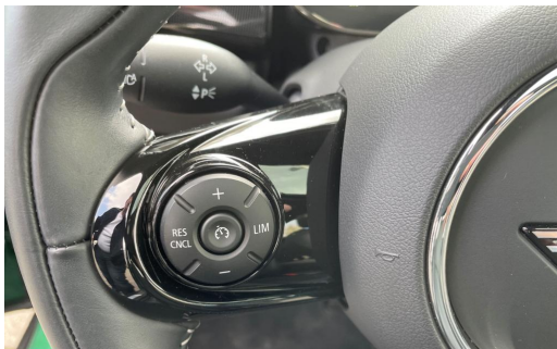
BMW MOTORRAD Auton Scania PAGO VOGELSANG AUTOMOBILE